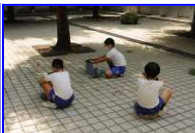
5年生バケツ稲植え替え